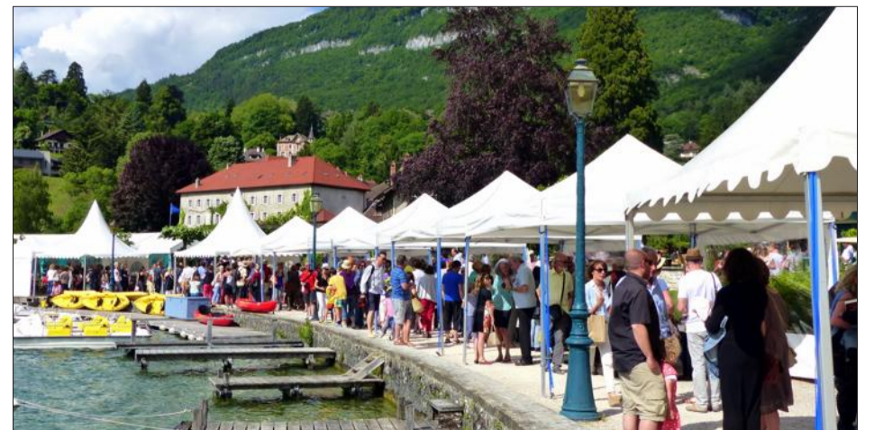
Comme l'an dernier, les séances de dédicace ont lieu au bord de l'eau.

Aujourd'hui, ouverture du salon et dédicaces dans la baie dès 10h30.